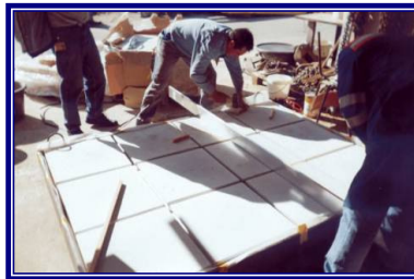
Colocación Loza en Modulo